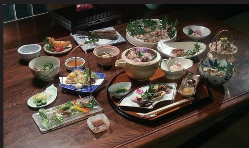
天然鮭尽くしコースです。杉ヶ瀬自信の鮭料理です。